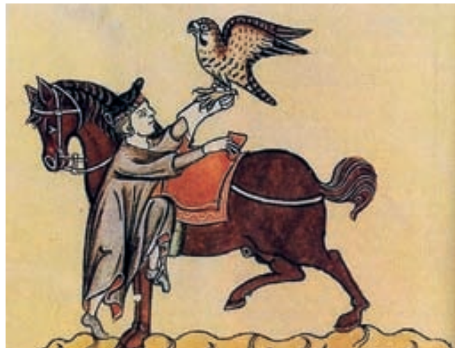
Cavallo per la falconeria dal De arte venandi cum avibus

regia curia. Quest'ultimo teneva una sorta di libro genealogico dei cavalli secondo l'uso in voga sin dal XII secolo, che si rifaceva alla linea paterna dei cavalli, mentre gli arabi registravano il "pedigree" secondo la linea materna.