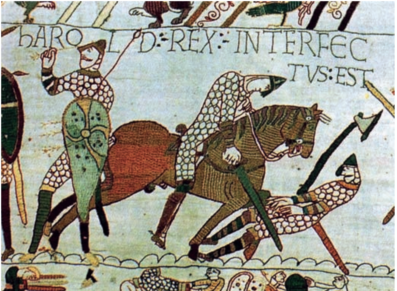
Cavalieri Normanni in battaglia

l'acqua riservata soltanto agli animali di Regia Corte". Oltre alla "marescalchia" delle razze della Capitanata, Spinazzola e Laterza era rinomata quella di San Gervasio, ove pascolavano le regie razze pugliesi.